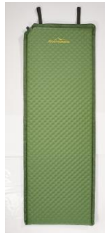
Abb. 2: Liegematte