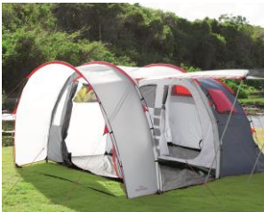
Abb. 1: Zelt