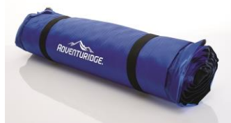
Abb. 5: Liegematte, eingerollt