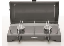
Abb. 6: Campingkocher