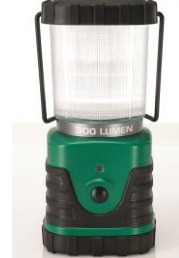
Abb. 7: Campinglaterne