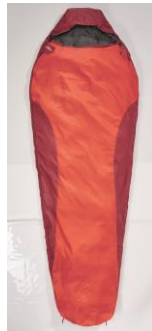
Abb. 3: Schlafsack