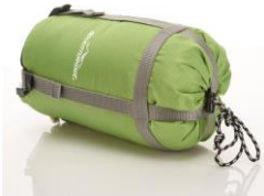
Abb. 4: Schlafsack, eingerollt