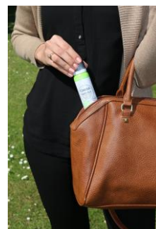
Abb. 4: Compressed Deo in Handtasche