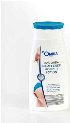
Ombia Med straff. Körperlotion 10%