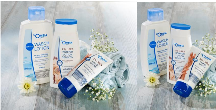
Ombia Med, ausgezeichnete Produkte, quer