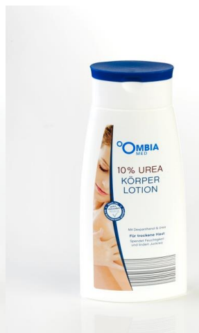
Ombia Med Körperlotion 10%