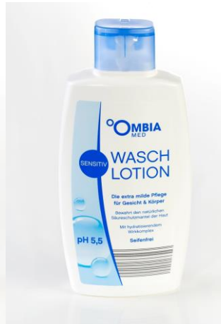
Ombia Med Waschlotion sensitiv