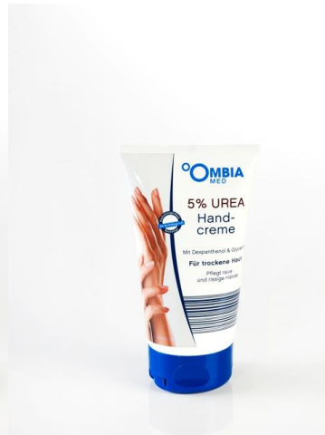
Ombia Med Handcreme 5%