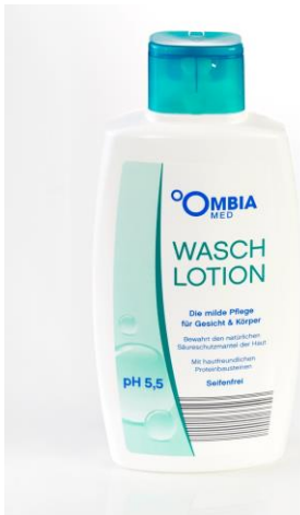
Ombia Med Waschlotion