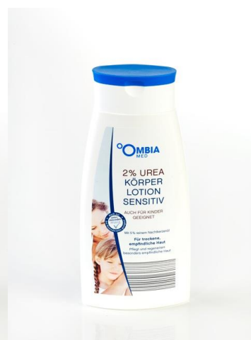
Ombia Med Körperlotion sensitiv 2%