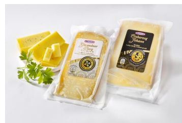
Abb. 3: „Gmundner Berg Premium“ / „Erzherzog Johann“