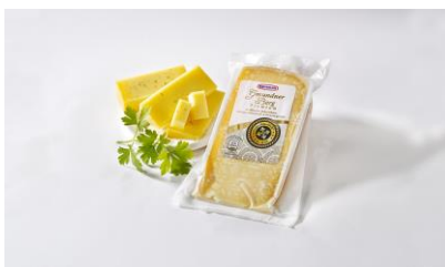
Abb.2: „Gmundner Berg Premium“