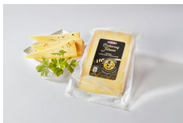
Abb. 1: „Erzherzog Johann“